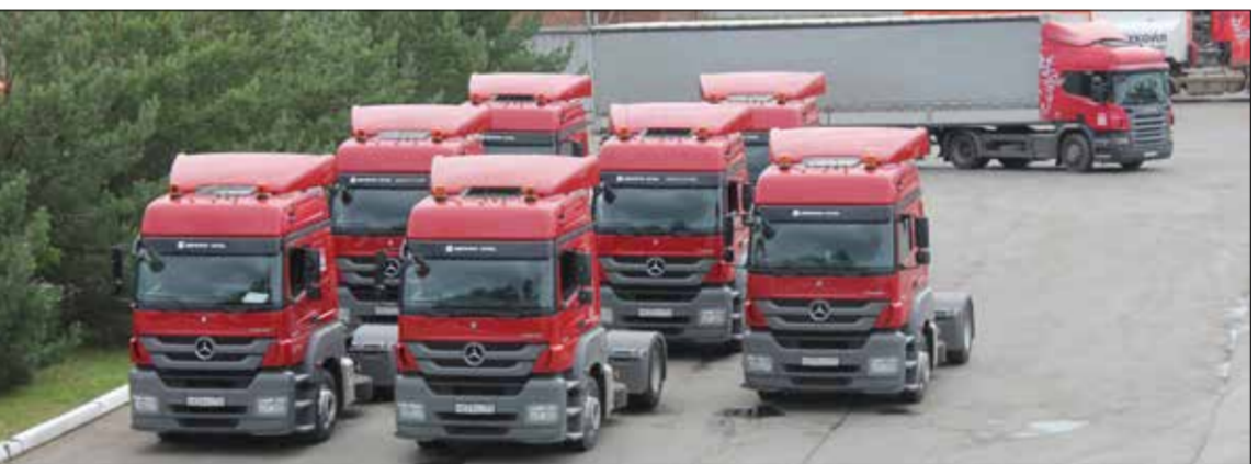
Новые тягачи «Мерседес» пополнили парк «Пермского транспортного предприятия».

изменений структуры сбытовых обществ. — В связи с присоединением «ЛУКОЙЛ-Пермнефтепродукт» к «ЛУКОЙЛ-Уралнефтепродукт» положительным фактором станет создание единой службы по расчетам за транспортное обслуживание (перевозки СНП, услуги легкового, пассажирского транспорта).