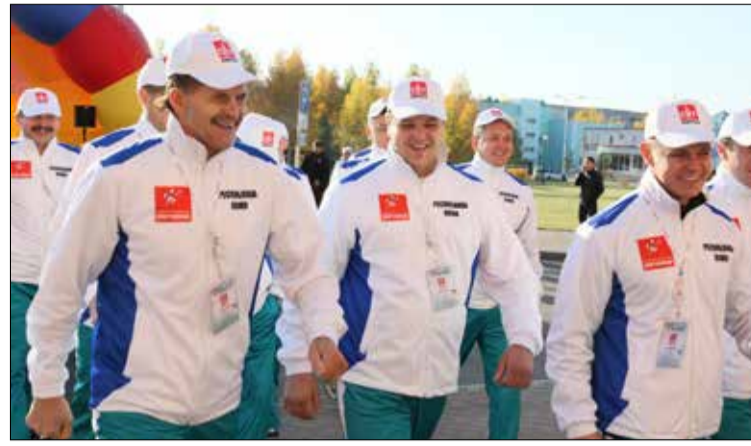
II Межрегиональная спартакиада среди работников ЗАО «Спецнефтетранс» в г. Лангепасе в 2014 г. задала высокую планку и спортсменам, и организаторам предстоящих состязаний в Перми!

нас стороной. Но на региональной спартакиаде в г. Пермь мы сумели собраться и одержали долгожданную победу. Познав в прошлом году вкус победы, хотим достичь новых высот! Победа в борьбе с сильными соперниками была бы большим успехом.