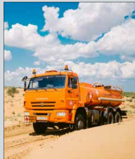
Вывоз нефти с Бешкульского месторождения.

Несмотря на сложные условия работы, водители нефтевозов добиваются высоких показателей. Среди передовиков следует отметить следующих водителей: А. Крота, А. Чебыкина, В. Жукова, Н. Неганова, А. Жиликова, В. Малашенко, М. Запороженко, В. Балакшина, Е. Родина, А. Красовского, А. Ковалева, А. Дурандина, С. Ермакова, Н. Чалова.