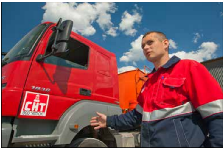
Новые направления и объемы «АТП-СНТ».

Сегодня «АТП-СНТ» заключило трехлетний договор на перевозку битума и других темных нефтепродуктов с Национальной ассоциацией