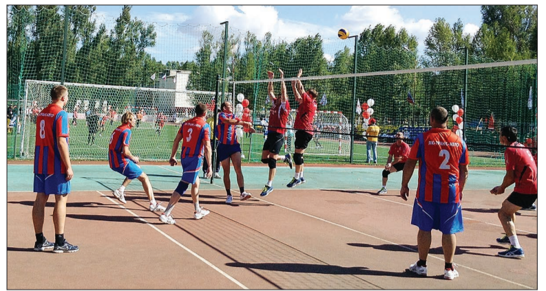
Волейболисты «Дороса» блокировали атаку команды «ЛК-Транс-Авто».