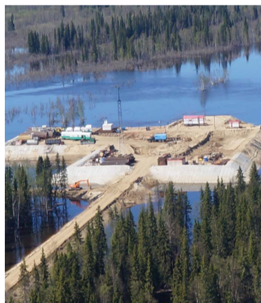
Куст № 2 месторождения им. А. Алабушина.