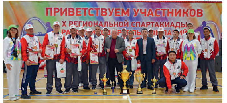
➤ Победители X региональной спартакиады АО «Спецнефте-транс» — сборная команда «Центр и Юг», сформированная на базе ЗАО «Нижневожского УТТ».

На X научно-практической конференции компании «Спецнефте-транс», проходившей в сентябре в г. С.-Петербурге, пятеро наших работников представили три разработки, актуальные как для нашего общества, так и для компании в целом.